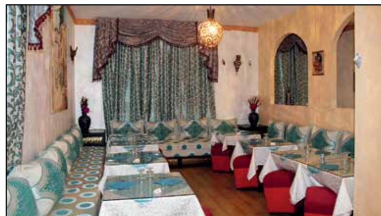
ALL'INTERNO SALE CLIMATIZZATE