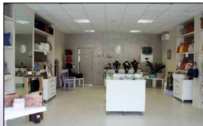
Il negozio di Madame Coco a Montichiari dopo la Farmacia Comunale.

Chiuso il lunedì Via Mons. V.G. Moreni, 83 - Montichiari (BS) - Tel. 030.962205