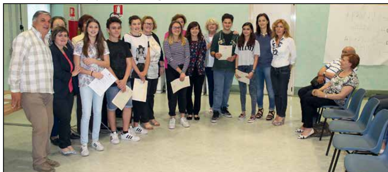
I vincitori con i dirigenti scolastici e dell'Aido.