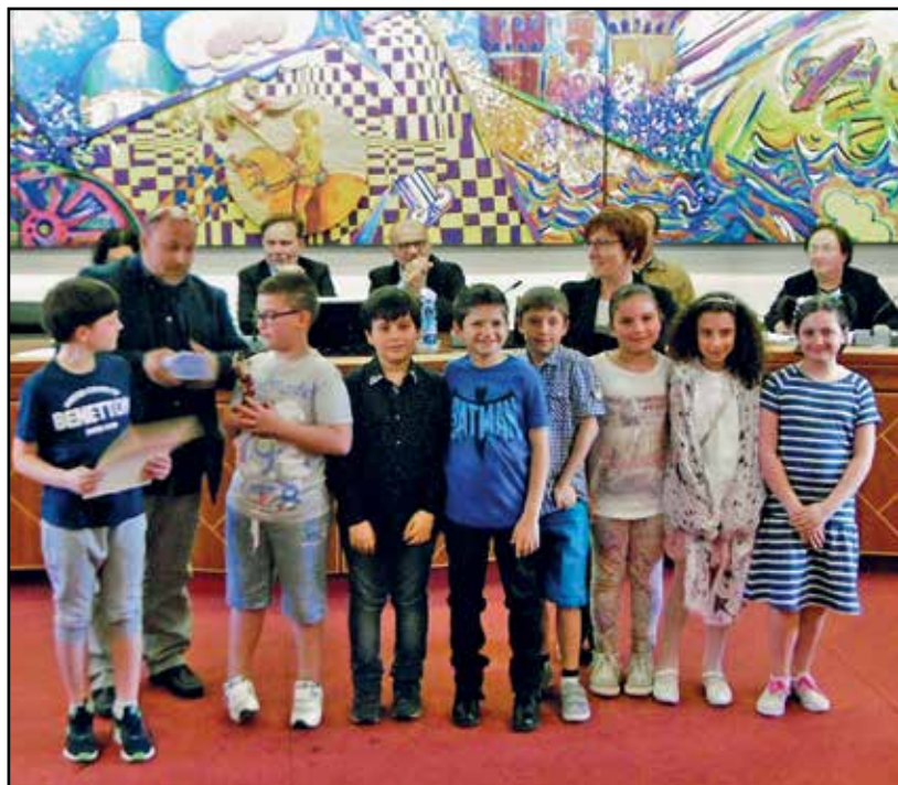
Una delle numerose premiazioni.

Il dott. Federico Migliorati, aprendo la seduta, ha sottolineato l'importanza della scrittura come manifestazione della propria creatività ed ha aggiunto, citando Carlo Cassola, "Scrivere è essere attenti al rumore continuo della vita." Ha preso poi la parola il vice-sindaco Basilio Rodella, che ha ringraziato la Pro loco, la giuria, gli insegnanti e tutti coloro che hanno reso possibile la realizzazione dell'evento, ed ha